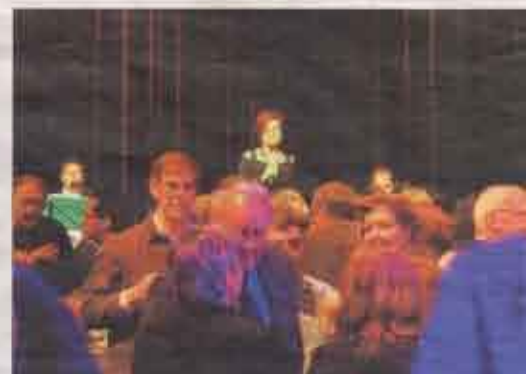
Just Friends zorgde met soms ingetogen, soms opzweepende muziek voor een passende omlijsting van de goed bezochte nieuwjaarsreceptie.